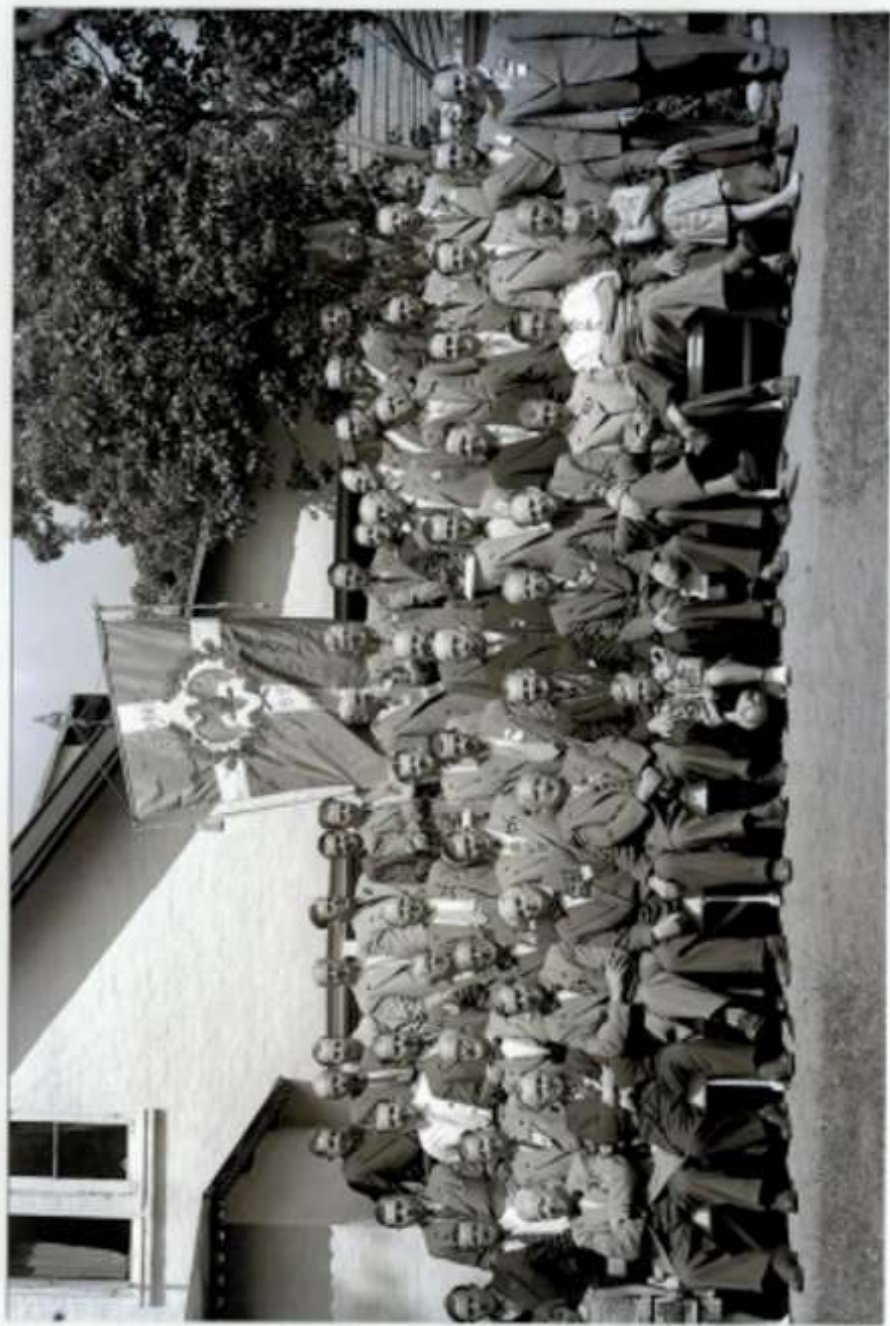
Fugleskydning 1956, Fredensborg