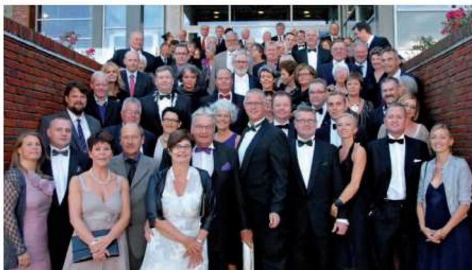
De festglade gæster på Hotel Griffens trappe inden festmiddagen.

Det var nu tid til hovedretten, som var en lækker, langstidsbagt oksemør-brad ristet med krydderurtecrunch og hertil kantareller, rodfrugter,