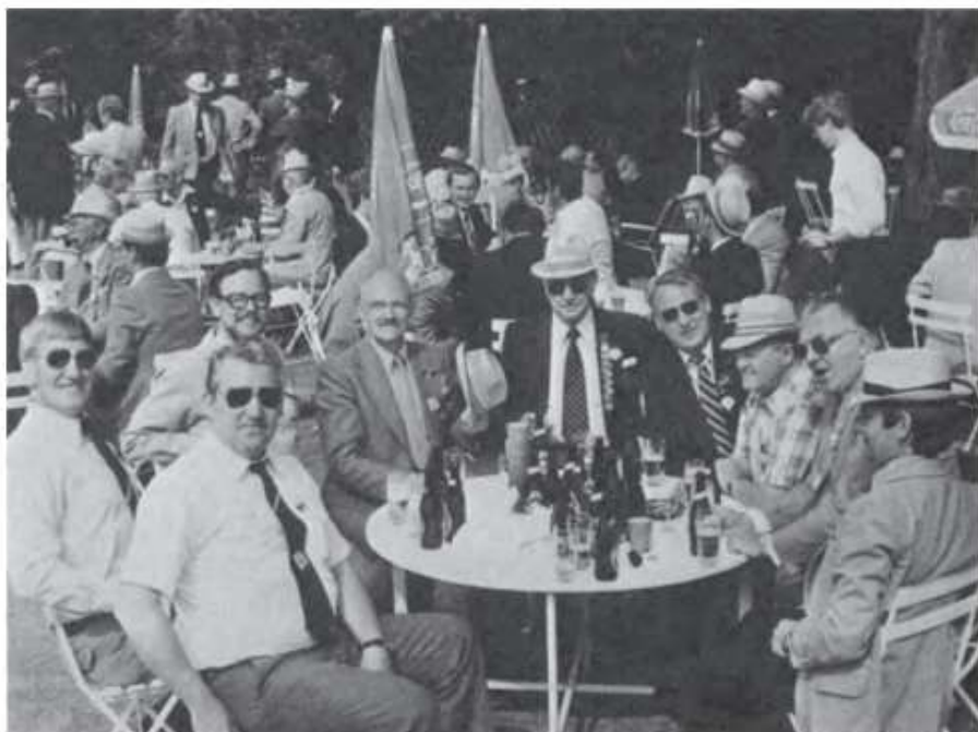
Skydebrødrene hygger sig mellem skuddene (1981)

Der kan fortælles meget om fugleskydningerne mand og mand imellem, der kan »spindes mangan god ende«, når skydebrødre mødes i festligt lag, men det kan nok falde lidt mat ud, når det skal sættes på prent. En udenforstående kan nok gøre sig tanker om det formålstjenlige i, at »vor far« tager sig en hel fridag – blot for at deltage i skydning til en træfugl, men en sådan betragtning er nu nok for negativ. Hvis der ikke var andet og mere i